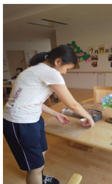
老人保健施設で活躍