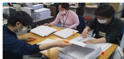
本部各部署からの依頼作業に活躍