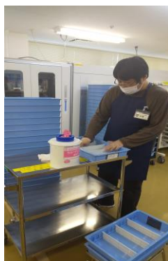
病院薬剤科で活躍