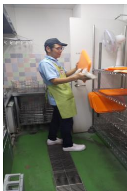
病院内のレストランで活躍