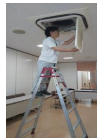
除草作業やフィルター清掃(本部)