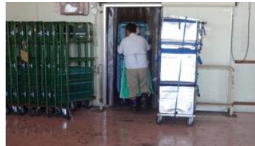
籠車ごと冷凍庫に搬入し明日に備えます。