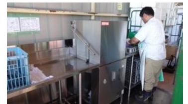
新しく設置された洗浄機。