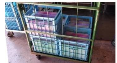
宅配から戻ったドライバーが使用済みの蓄冷剤を水色のケースに移し替えて籠車に収納します。