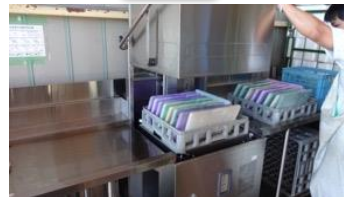
水色のケースから、洗浄用のケースに移し替えて、洗浄機にセットします。洗浄が終わると自動的に停止します。