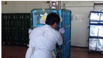
洗浄後、再度水色のケースに戻して籠車にのせ、しばらく日向で乾燥させてから冷凍庫へ移動します。籠車はおよそ200kgになります。