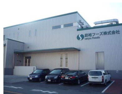
平成24年9月稼働の本社工場