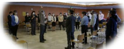
ワークショップ風景