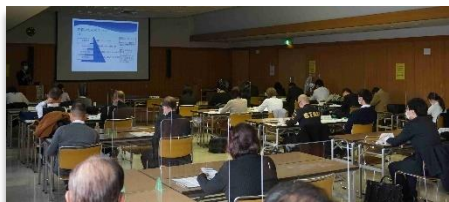
関口氏による講演風景