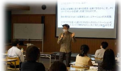
当事者による講義 (2日目)

ークシヨ ップ『マ シヨリテ イ(多数 派)をさ がせ』等 当事者を 講師とし て招き、