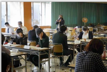
グループワーク風景 (1日目)

ークシヨ ップ『マ シヨリテ イ(多数 派)をさ がせ』等 当事者を 講師とし て招き、