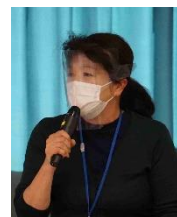
企業からの 実践報告 (1日目)

「ワークシヨップで、発達障害者の感覚を体験し、少し理解できたと思う」「仕事に活かせる知識を深めることができた」と、多くの感想が寄せられました。