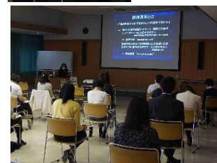
医師による講演 (2日目)