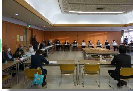
ソーシャルディスタンスを取りながらの情報交換会風景

アンケートでは「精神障害者の方との接し方が学べた」「企業の中だけでは解決つかないこともあり、支援機関等の方と一緒にやっていく方が良いことがわかった」など、今後の取組に活かせるという感想を多く頂戴いたしました。「情報交換の時間がもう少し欲しかった」とのご意見もあり、今後の企画に反映したいと思います。